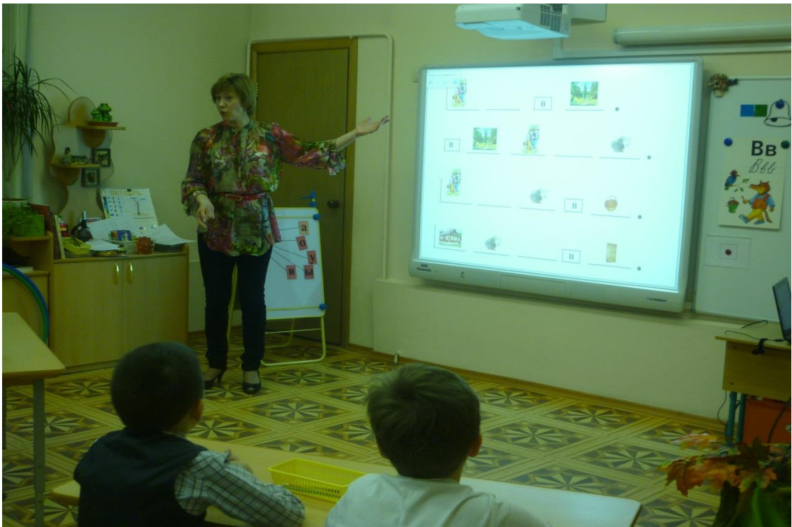
10. Итог занятия.