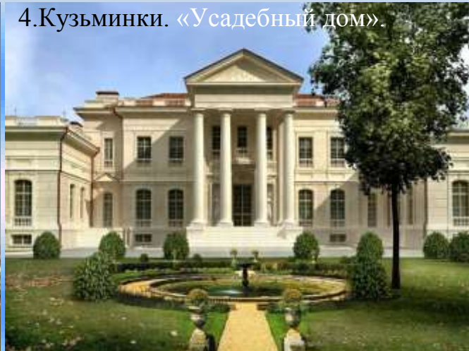
4. Кузьминки. «Усадебный дом».