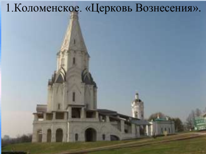
1. Коломенское. «Церковь Вознесения».