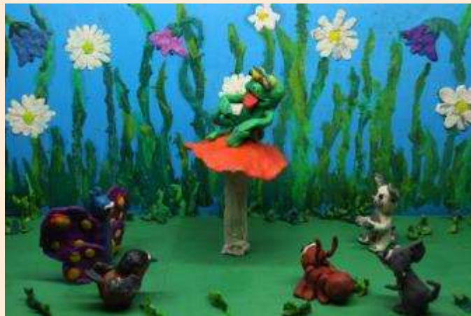
Мультфильм «Под грибом»

Пластилиновая анимация вышла из кукольной анимации и стала популярной у нас в России после появления мультфильмов "Падал прошлогодний снег" режиссера Александра Татарского.