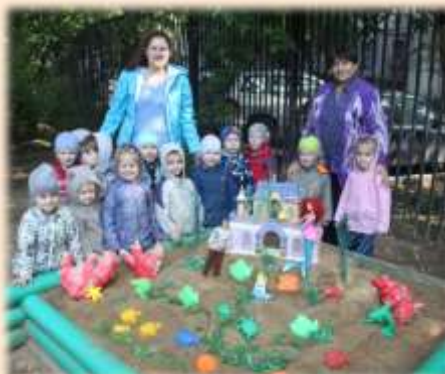
Страна фантазий «Замок Русалочки»