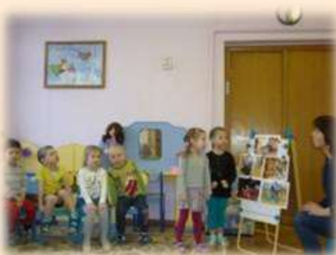
«Поступки добрые и злые»

Эвристическая беседа - один из словесных методов обучения. Сущность эвристической беседы состоит в том, что воспитатель путем постановки перед детьми определенных вопросов и совместных логических рассуждений подводит их к определенным выводам, составляющим сущность рассматриваемых явлений, процессов, правил и т. п.