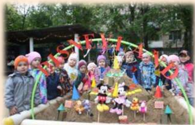
Вход в Диснейленд