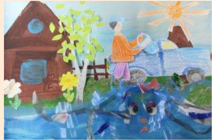
Мультфильм «Ванина речка»