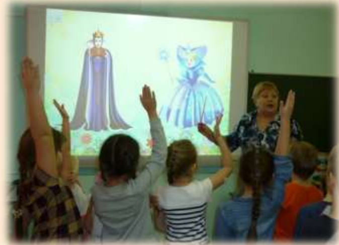
«Научись сердцем творить добрые дела»