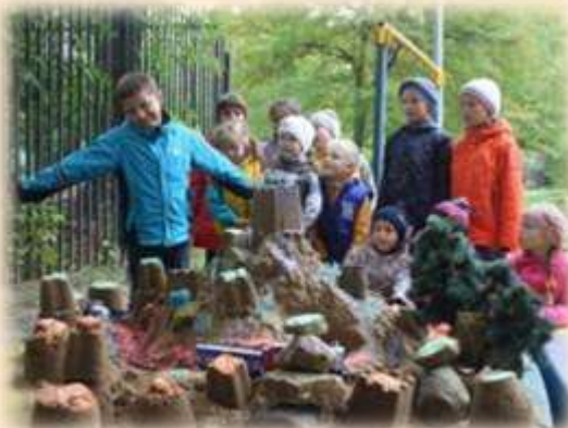
Страна будущего Железная дорога Диснейленда