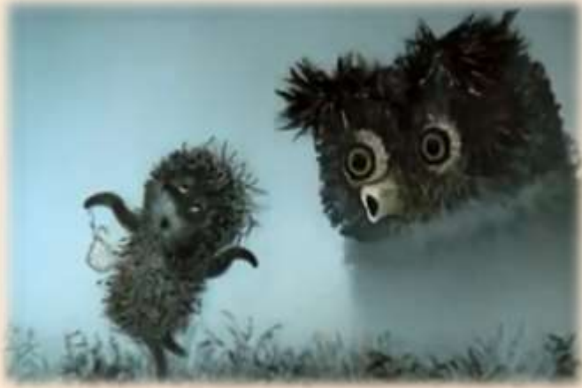
«Ежик в Тумане» режиссера Юрия Норштейна.