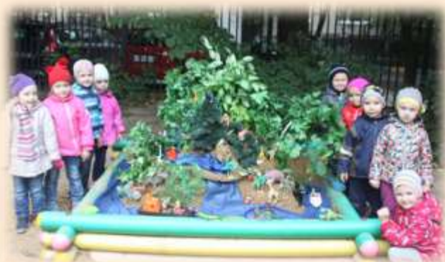
Мир приключений «Круиз джунглями»