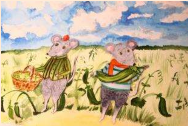
Мультфильм «Сказка про Тимку и Кузьку»