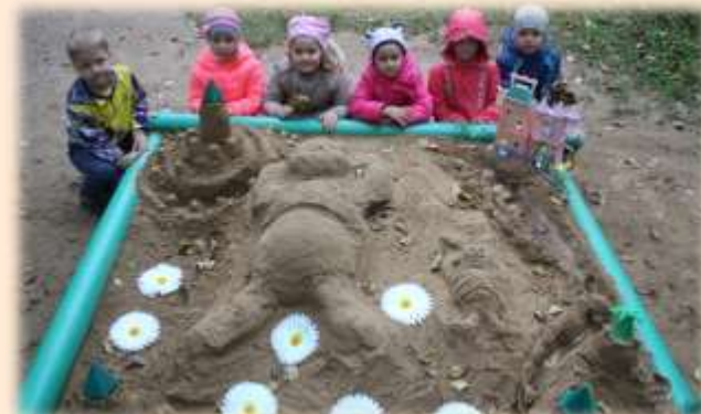
Мир животных «Земля медведя»