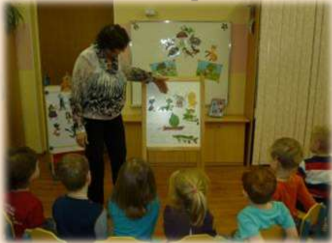
«Дружба в мультфильмах»