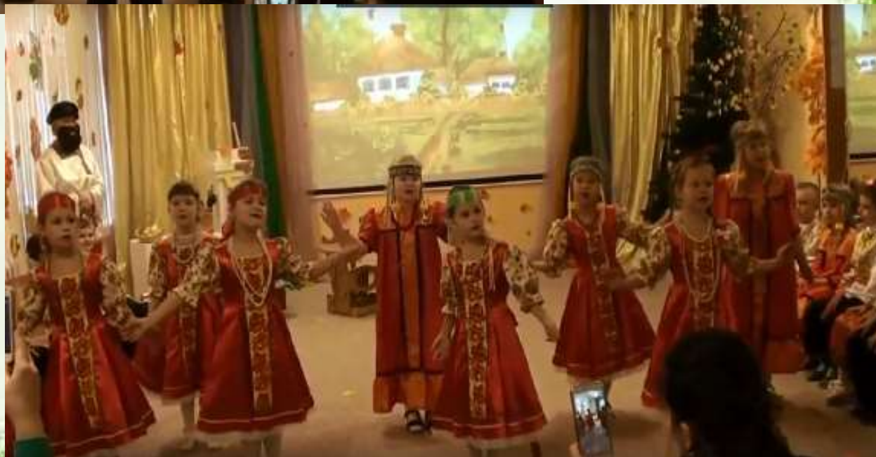
«Как за двором, за двором»