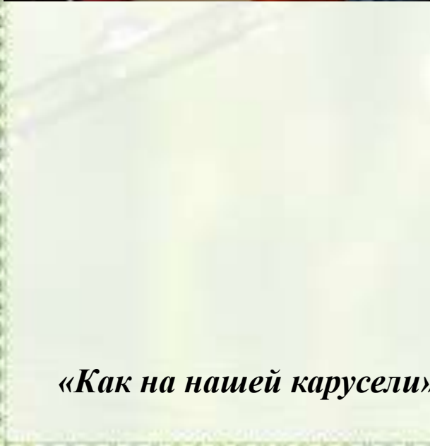
«Как на нашей карусели»