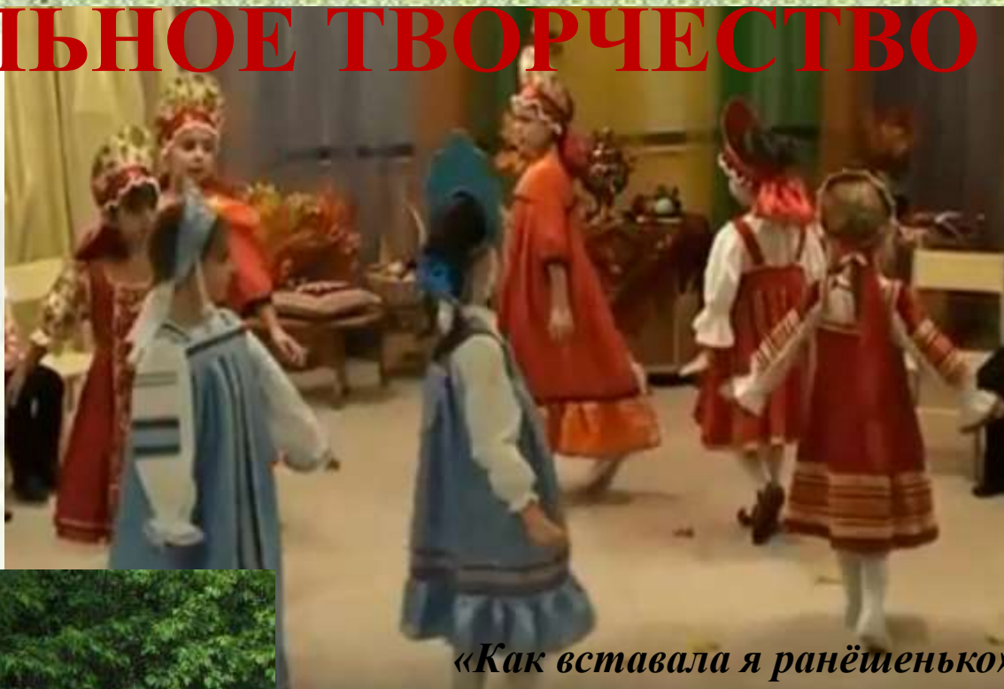
«Как вставала я ранёшенько»