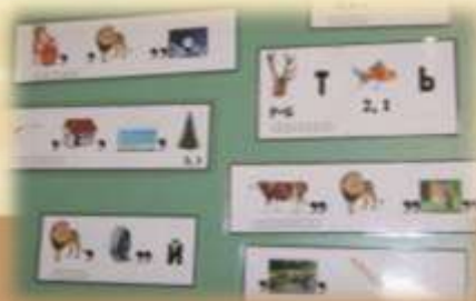
Ребусы по сказкам А.С. Пушкина