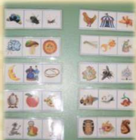
Дидактическая игра «Третий лишний»