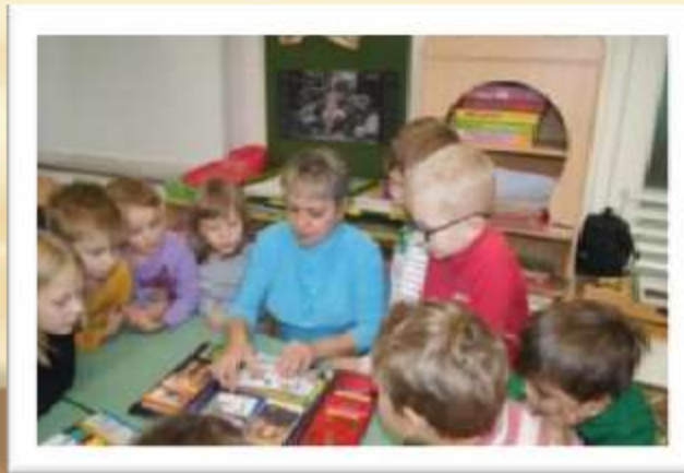
Знакомимся с художниками- иллюстраторами сказок А.С. Пушкина