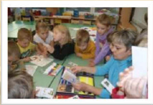
Дидактическая игра «Доскажи словечко. Назови сказку»