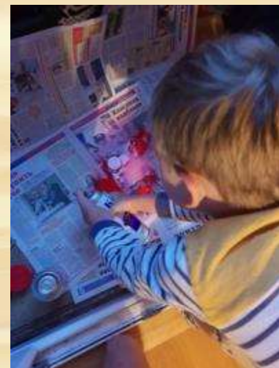
Оформление кнопок «старт» и «финиш» для игры