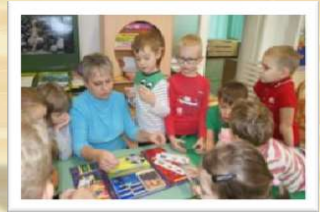
Дидактическая игра «Соедини картинки» (круги Луллия)