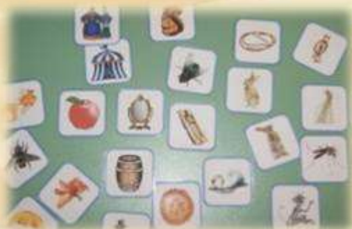
Дидактическая игра «Найди все картиннки из одной сказки и назови её»