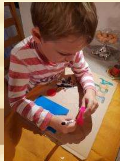
Оформление названия игры