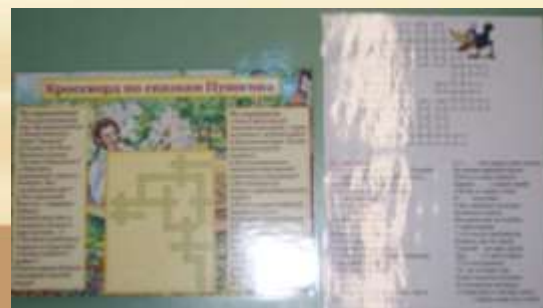
Кроссворды по сказкам А.С. Пушкина