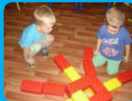
Солнце из конструктора