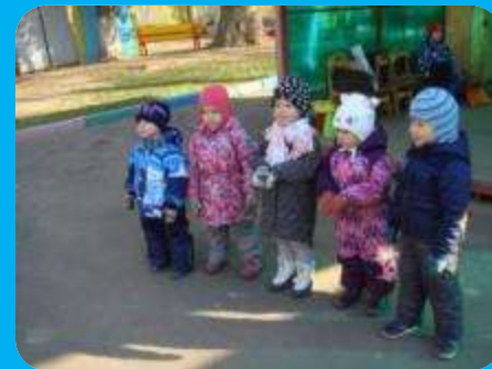
« Солнечный зайчик»