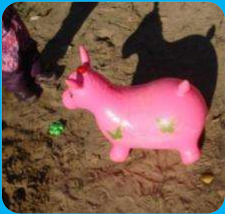
«Тень и солнце»