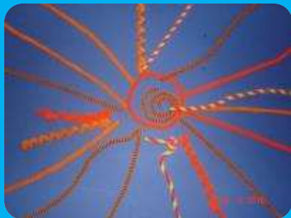
Солнышко из спиралек