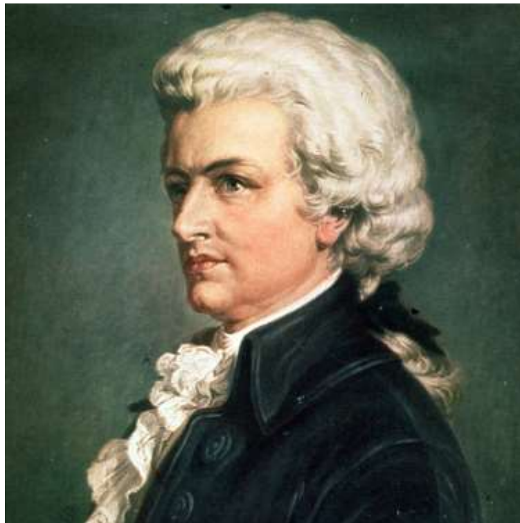
Вольфганг Амадей Моцарт