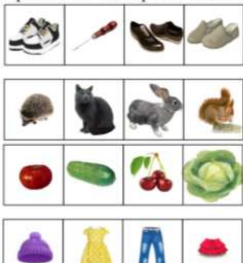
Упражнение "Четвертый - лишний"

Кошка :Найдите в каждом ряду лишнюю картинку и обведите её в кружок .Объясните свой выбор .Назовите все лишние картинки ,чётко произнеся звук Ш.(Один ребёнок выполняет у интерактивной доски ,остальные за партами.)