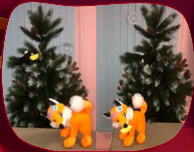
«Ворона и лисица»