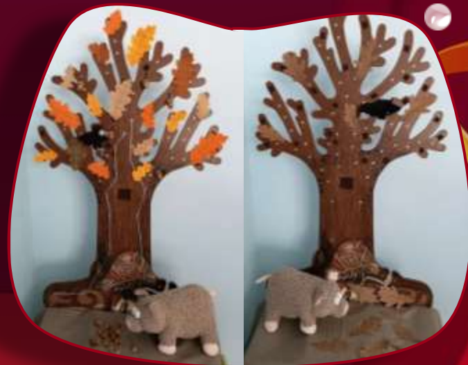
«Свинья под дубом»