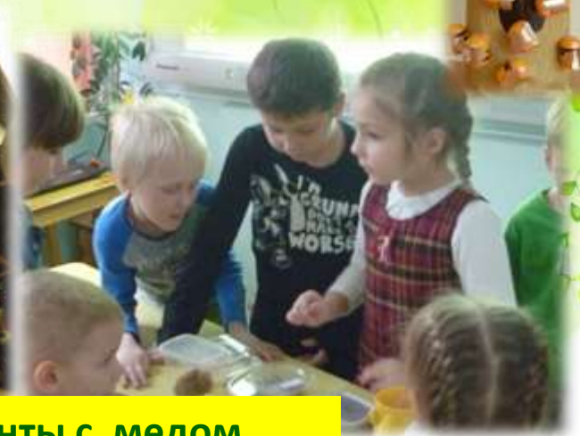
Эксперименты с медом