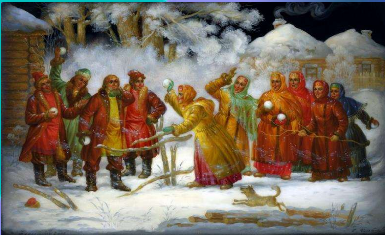
Игра в снежки

Но прошло время. Благодаря царю Петру I, праздновать Новый стали зимой, в ночь с 31 декабря на 1 января. И до сих пор мы так и празднуем этот праздник. Царь Петр I издал указ, чтобы на улице наряжали елку, всю ночь народ веселился, чтобы люди поздравляли друг друга, желали друг другу здоровья, счастья, радости и благополучия. И люди гуляли всю ночь, играли в зимние забавы... Какие вы знаете зимние забавы? (Дети перечисляют)