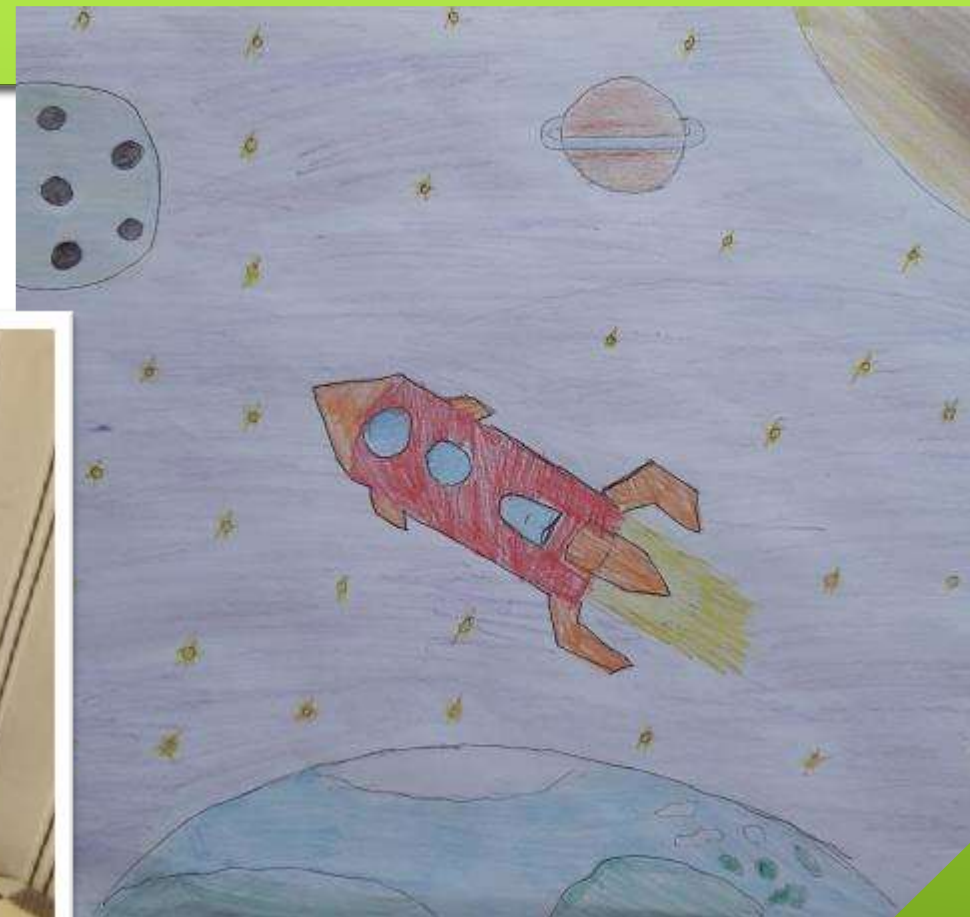
Лаврентьева Даша – рисование «Полет на Луну»