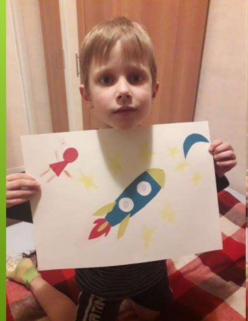
Ипполитов Максим – аппликация «Полет на Луну»