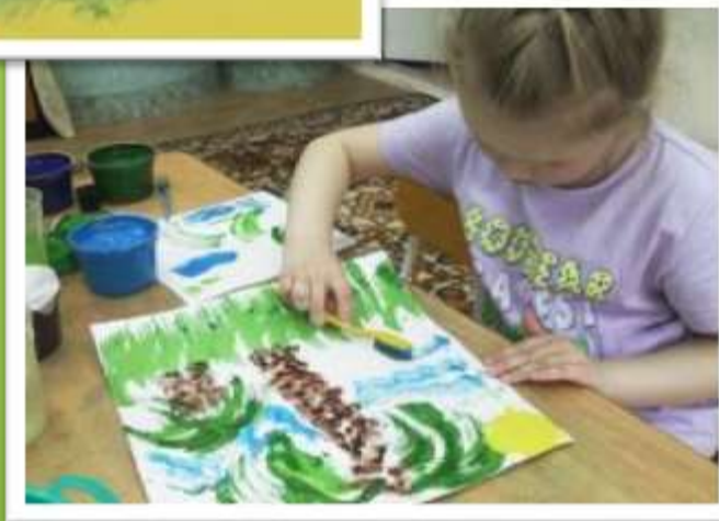
Рисование зубной щеткой