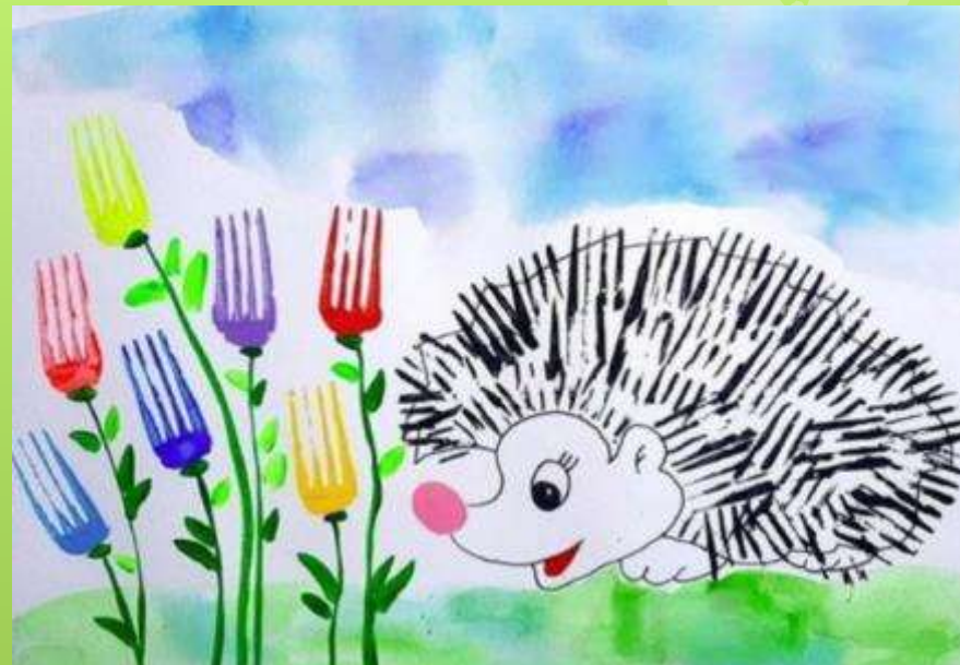
Примеры детских работ