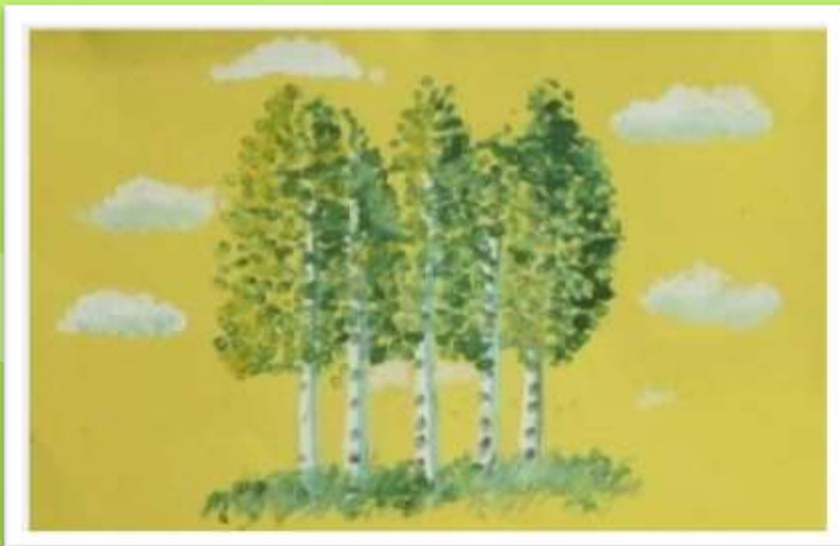
Рисование по соли