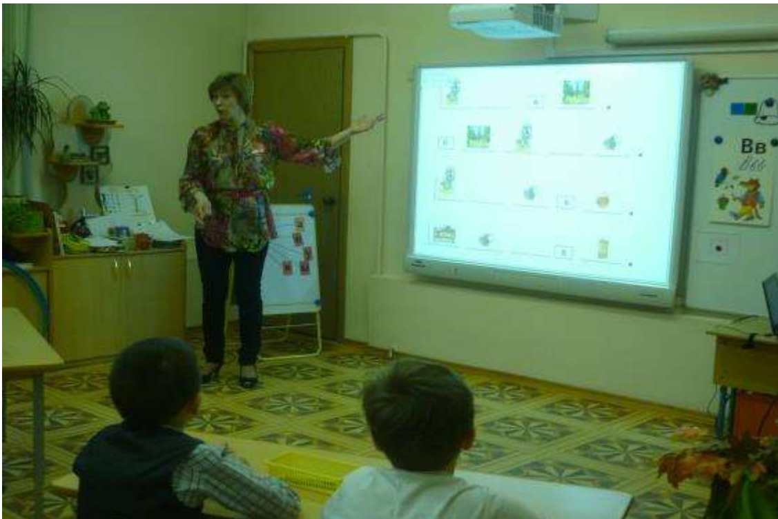
10. Итог занятия.